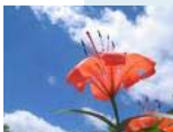
Por Hugh Prather

Al comienzo de nuestra jornada, la experiencia del Amor puede aparecer y desaparecer rápidamente, dejando largos períodos relativamente sombríos. No obstante, en el fondo habrá una sensación creciente de inocencia y una convicción cada vez más profunda de que un Amigo camina a nuestro lado y que él amorosamente nos tiende la mano. Con el tiempo queda claro que no hemos sido abandonados por la Realidad, sino que solamente hemos elegido desviar la mirada por un rato.