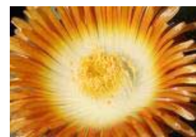
El Fin Del Sueño Por Helen Schucman

migo y que su quietud cubra a la tierra por siempre. Está cumplido. Padre, tu Voz me ha llamado a casa por fin: el sueño se ha ido. Despierta, hijo Mío, en el amor.