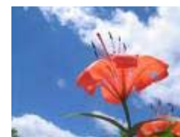
El Regreso A Casa Por Hugh Prather

Debemos llevar a cada parte de nuestro ser y a cada instante del día la decisión de caminar directamente al corazón de Dios. No debemos excluir a nada ni a nadie. Debemos hacer de ella el pensamiento con que nos despertamos y la meta que acariciamos al dormir. No debemos ver a ninguna persona como si no tuviera luz, y así la luz comenzará a penetrar por cada rincón y recoveco de nuestro entorno, hasta que finalmente reconozcamos que nunca hemos dejado el Lugar donde el Amor nos cobija.