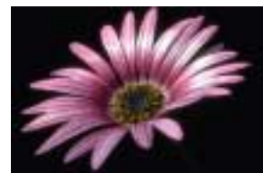
La Profundidad Y Complejidad De Un Solo Párrafo Por Robert Perry

Este es el rol que nuestro ego dice tener en nuestras relaciones. Es nuestra guía en materia del amor, aconsejándonos acerca de cómo podemos unirnos realmente. Es cierto, es la voz estridente en nuestra cabeza que dice "¡Abandona! Este tipo es imposible." Sin embargo también es la voz conciliadora que dice, "¿Por qué no cedes ahora? Si puedes conceder terreno en este punto, ganas palanca