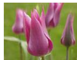
Soltar Por Ian Patrick

El Espíritu Santo responderá a nuestras plegarias y pedidos de ayuda. Y sólo se necesita una "pequeña dosis de buena voluntad" (T-18.IV). "Que pueda perdonar [a esta persona] y soltarlo a Tu cuidado." "Ayúdame a soltar mi apego a que [esta situación] sea lo que quiero." "Ayúdame a dar un paso al costado y que Tú me guíes."