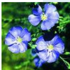
Por Allen Watson