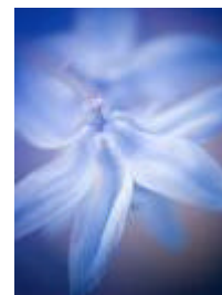
Elegiendo La Vida