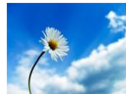
Un Cuento De Resurrección

Pongámosle atención a la vida que compartimos con Dios y la guía del Espíritu Santo. Esto nos enseñará al impecable, libre y dichoso Hijo de Dios que nosotros y nuestros hermanos somos.