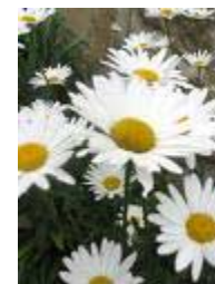
El Ego Siempre Está Tramando Algo

En tres años, Palabras a mí mismo se había convertido en un bestseller en todos los Estados Unidos. Después llegaron las traducciones a numerosos idiomas y las ediciones audio, y veinte años después continúa siendo un éxito de ventas en todo el mundo. Después de la publicación de su primer libro, Hugh y Gayle hicieron muchos otros, entre ellos Notas espirituales para mí mismo o Palabras a mi pareja. Se dedicaron a la asistencia terapéutica de