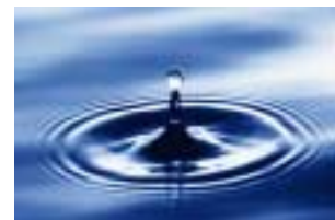
El Océano De Tu Mente

A medida que flota, ves como el agua se entibia a medida que el sol brilla sobre él. Cuando se ha puesto el sol, ves que el agua refleja con calma la luz de la luna. Y mientras sigue girando la rueda de días y noches, ves que las mareas van y vienen como siempre lo han hecho. Estos ciclos eternos simplemente continúan, como lo han hecho durante millones de años, como lo harán por otros millones de años más, sin atender en lo más mínimo a tu pequeño palo.